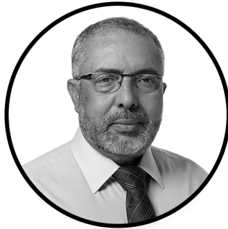
PAULO PAIM SENADOR